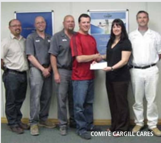
COMITÉ CARGILL CARES

Les familles qui doivent composer avec la SP font souvent face à des frais médicaux importants tout en disposant d'un revenu limité, ce qui laisse un bien maigre budget pour les activités sociales et les loisirs de leurs enfants. Grâce au seul soutien généreux du comité Cargill Cares, la Division de la Saskatchewan a instauré un programme de subvention aux loisirs pour enfants. Dorénavant, les enfants de la Saskatchewan touchés par la SP sont de plus en plus nombreux à participer à des activités récréatives.