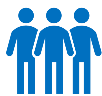
Parents et amis des personnes atteintes de SP